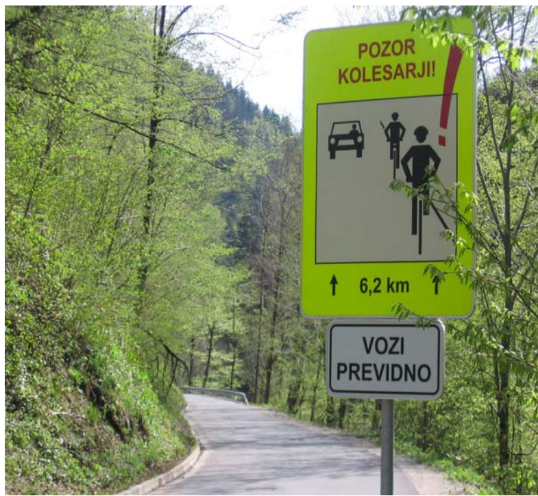
Sliki 10: Predlagamo prometni znak na cesti proti Kanomlji

Na cesti med Spodnjo Idrijo in Kanomljo se v obe smeri postavi prometni znak »Pozor kolesarji«.