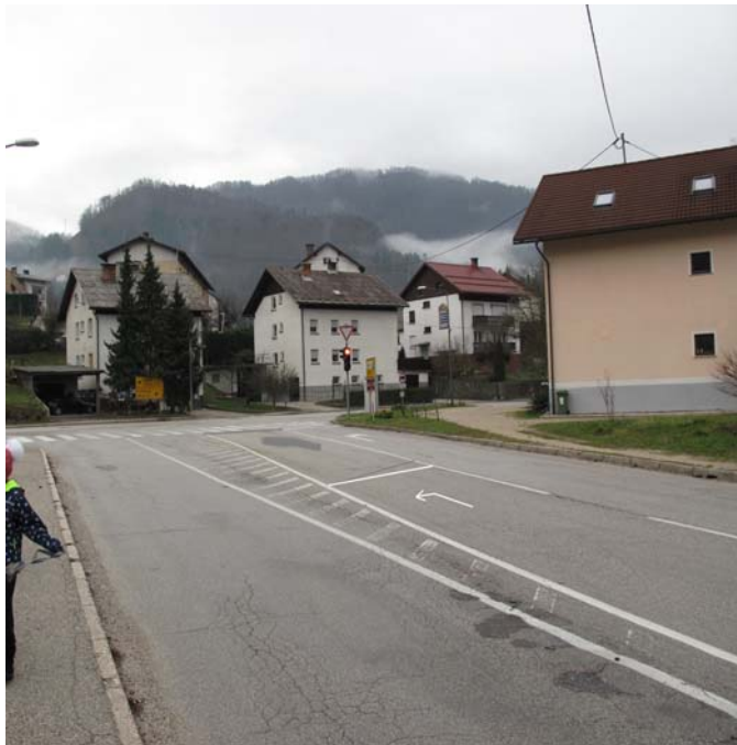
Slika 11: Predlagamo skrajšan pas za vozila, ki v križišču zavijajo levo – na sliki je simulacija

Obrazložitev: Predlagamo zeleno puščico na semaforju za vozila, ki prihajajo iz smeri Kanomlja. Zaradi boljše preglednosti na prehod za pešce podajamo dodaten predlog, da se pas za vozila, ki zavijajo levo SKRAJŠA. S tem omogočimo boljšo preglednost na prehod za pešce.