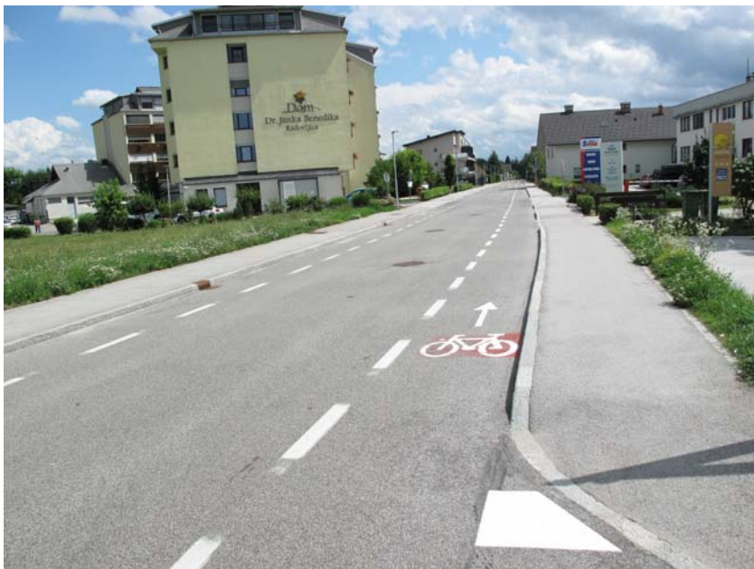
Slika 3: Primer cestišča z ustrezno označenim stranskim kolesarskim pasom na obeh straneh vozišča z ali brez sredinske črte