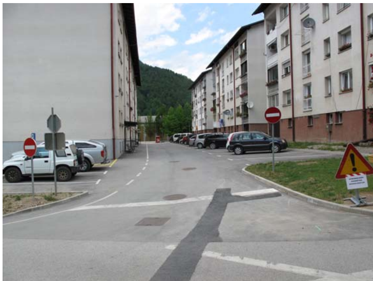
Slika 9: Talna oznaka-črta pri STOP znaku (predlog: vse črte narisati vzporedno z glavno ceto)

1. Predlagamo, da so vse črte narisane vzporedno z glavno cesto.