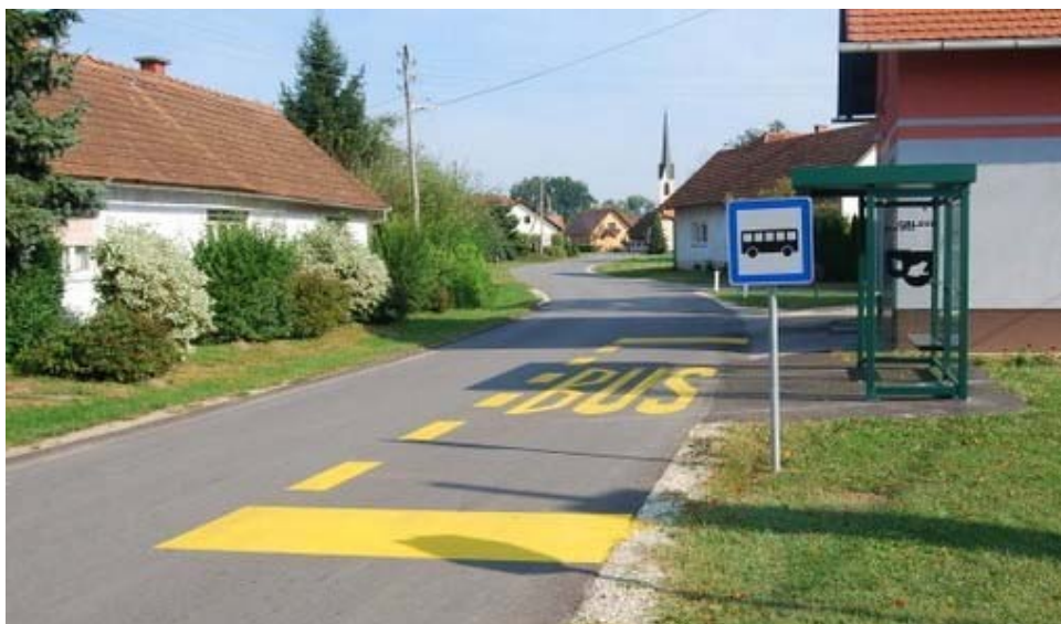
Slika 8:Primer ureditve avtobusnega postajališča

Predlog: Predlagamo ureditev postajališč-postavitve novih hišk, talne oznake, prometni znak. Nasvet za učence: Previdnost, nošenje odsevnega telovnika.