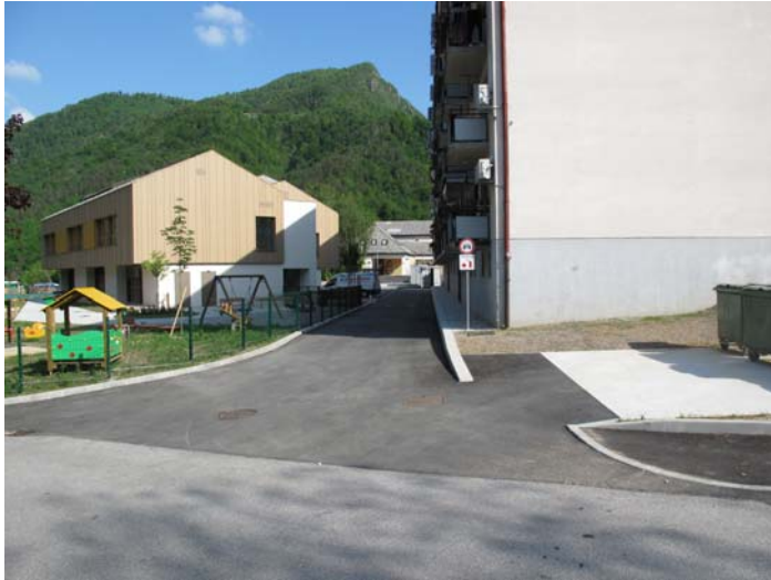
Slika 4: Pogled na šolsko kolesarsko in peš pot med vrtcem in stanovanjskim blokom

Predlog: narisati rob ceste in začetek peš poti med ter barvne talne označbe