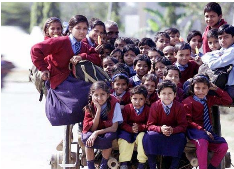
Slika 13: Delhi, Indija – Primer prevoza v šolo z tuk tuk rikšo.