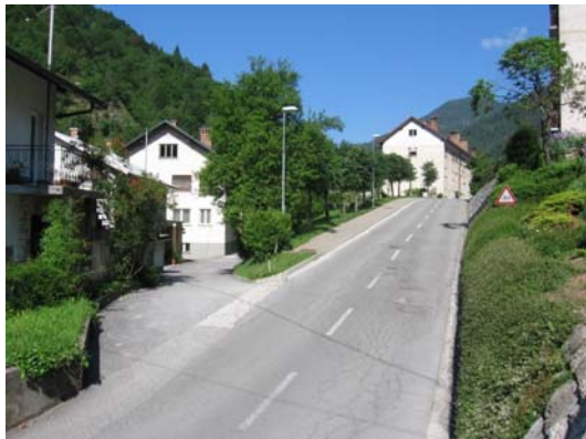
Slika 2: Oznaka ceste na klancu, ki vodi do šole. Talne oznake na obnovljeni cesti niso ustrezne, ker ne poskrbijo za zadostno varnost kolesarjev

Predlog: Pri talni signalizaciji je potrebno poskrbeti za varnost učencev, ki se v šolo pripeljejo s kolesom. Upoštevati je tudi potrebno, da je zgrajena nova kolesarska pot do Spodnje Idrije in da bo uporaba trajnostnega načina prevoza, kot je kolesarjenje, v porastu. Predlagamo talne oznake, kot je prikazano na sliki 3.