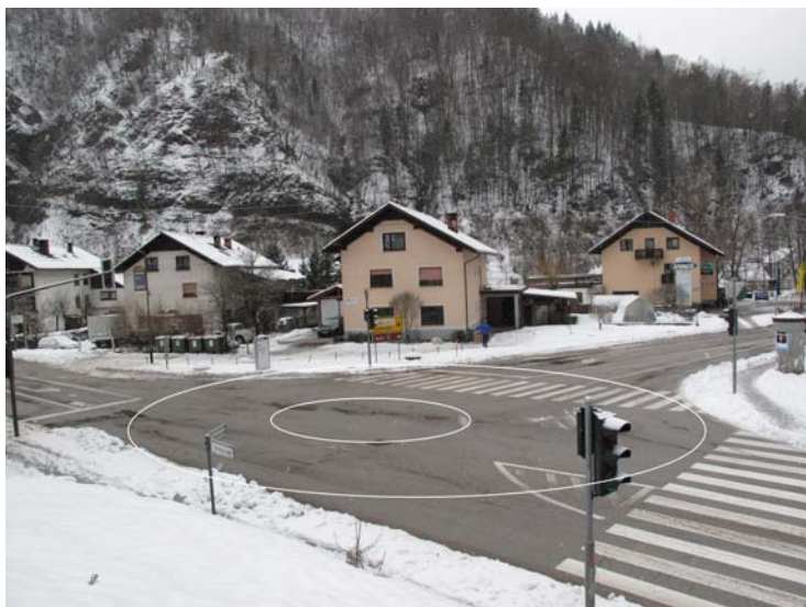
Slika 12: Primer krožišča– na sliki je simulacija

Obrazložitev: V istem križišču je v okolici križišča dovolj prostora za izgradnjo krožišča-najboljša rešitev.