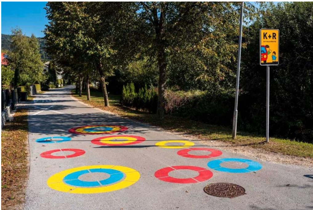
Slika 5: Primer barvne talne označbe kolesarske in peš poti