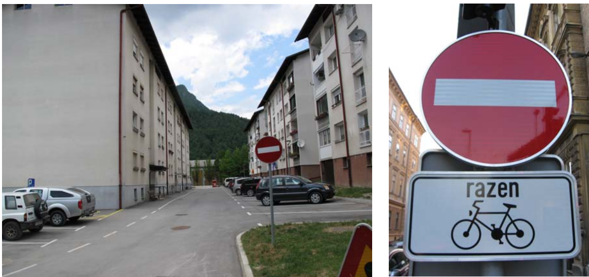
Sliki 6 in 7: Pogled na ulice v okolici šole in predlagana dopolnilna tabla

Predlagamo, da se v enosmernih ulicah v stanovanjskem naselju blizu šole dovoli promet za kolesarje v obe smeri. Na prometni znak »Prepovedan promet v eno smer« se doda dopolnilno tablo z napisom: »Dovoljeno za kolesarje«.